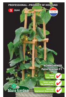
0644 - pagina 30