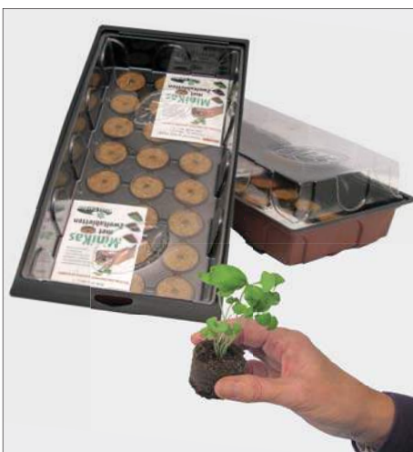
Kweekkasje met zweltabletten

Afharden noemt men het in etappes aan het buitenklimaat laten wennen van binnenshuis of onder glas gekweekte plantjes. Deze plantjes zet men eerst wat koeler voordat ze buiten op de plaats van bestemming worden uitgezet. Let vooral op het heersende weertype, want dat is van belang en bepaalt wanneer de plantjes de definitieve plaatsing aan kunnen.