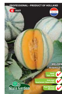
0669 - pagina 30