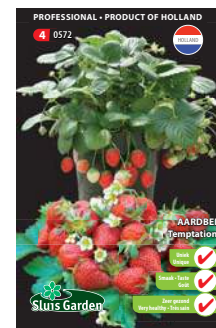
0572 - pagina 27