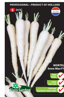
0478 - pagina 25