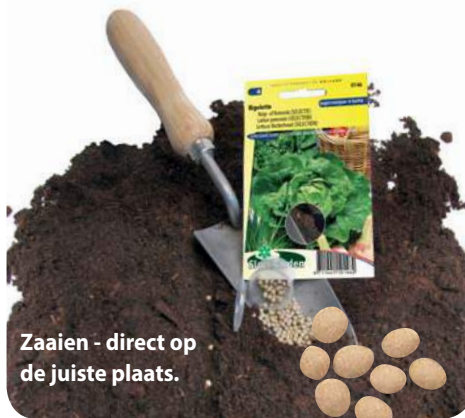
Zaaien - direct op de juiste plaats.

Onze pillenzaaden worden netjes in een pillenkaart met blister verpakt ter bescherming van breuk. Pillenzaad is handig, omdat het gemakkelijk zaait door de pilvorm en doordat het direct op de juiste plaats kan worden gezaaid, is uitdunnen niet meer nodig. Onderstaande soorten die als gepilleerde zaden beschikbaar zijn.