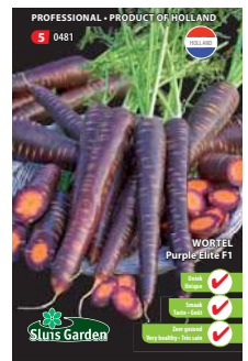
0481 - pagina 25