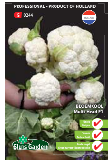
0244 - pagina 20