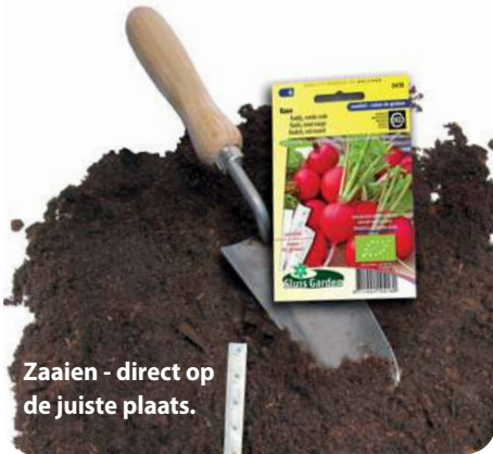
Zaaien - direct op de juiste plaats.

Zaadlint is gemakkelijk en snel. Gemaakt van papier dat zichzelf in de grond oplost. Leg de zaadlint op een vlak zaai-bed, maak ze nat en bedek met ca. 0,5 cm aarde. Daarna licht vochtig houden. U kunt de zaadlinten gemakkelijk knippen op iedere gewenste lengte.