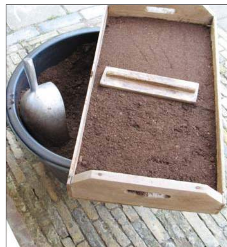
Vullen en vlak maken

Potgrond is over het algemeen uitstekend geschikt, maar er bestaat ook speciale zaai- en stekgrond. Vermiculite is voor de fijnere en vaak duurdere zaden uitermate geschikt. Vermiculite is een mineraal zaaimedium (magnesium) en bevat totaal geen ziektekiemen. Het laat veel vocht toe en