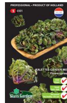
0301 - pagina 20

Bij de Groenten soorten zijn 14 soorten in de "Professional Series" PRO opgenomen. Soorten met zeer bijzondere eigenschappen zoals prijswinnaars, professionele soorten, variëteiten met aparte groei- en bloeiwijze.