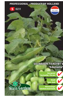
0231 - pagina 19

Gepilleerde zaden. Tuinderskwaliteit. Een winterprei met uitstekende vorstresistentie. Oogstbaar tot einde winter. Produceert een ca. 25 cm lange, donkergroene prei. Zeer goed resistent en na oogst lang bewaarbaar.